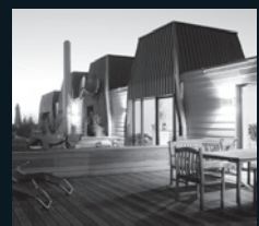
SANIERUNG IM BESTAND