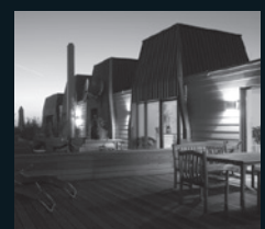
SANIERUNG IM BESTAND