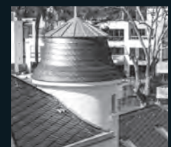
SANIERUNG IM BESTAND