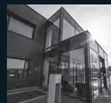
INDUSTRIE- UND GEWERBEBAU