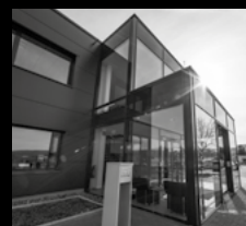
INDUSTRIE- UND GEWERBEBAU