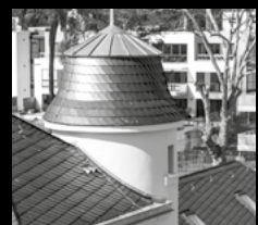
SANIERUNG IM BESTAND