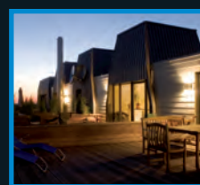
SANIERUNG IM BESTAND